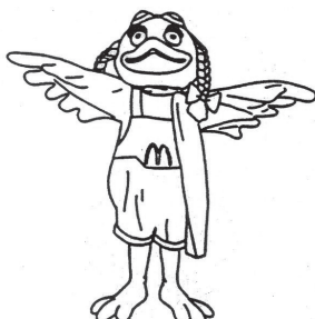
Birdie the Early Bird

Société MCDONALD'S CORPORATION 110 N. Carpenter Street 60607 CHICAGO - Etat de l'Illinois (États-Unis d'Amérique)